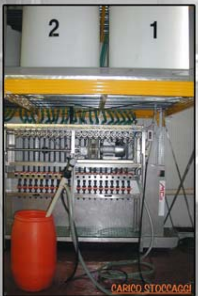
Carico prodotti Products loading