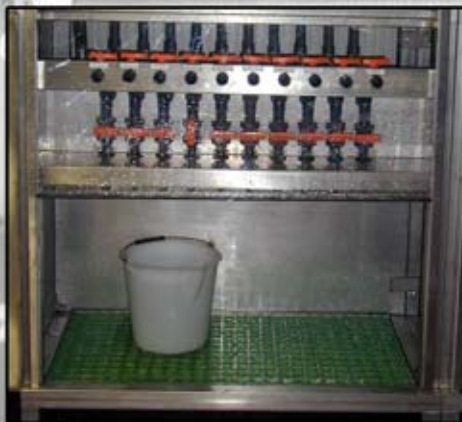
Prelievo manuale Manual take-off