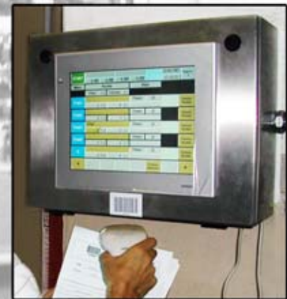
Pc+Plc di gestione interfacciabili a sistemi informatici esterni. Pc+Plc to interface with external systems.